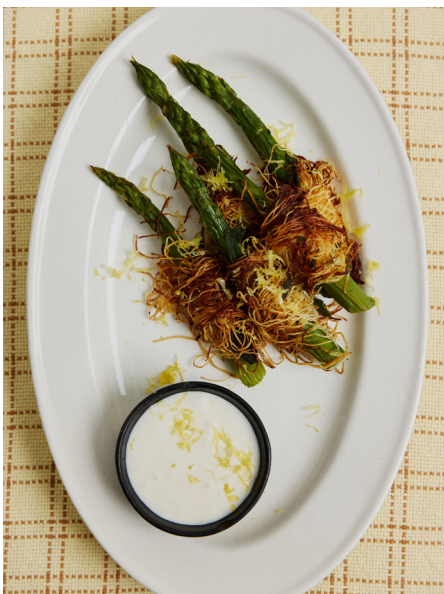
Asperge met kadaïfkrokantje