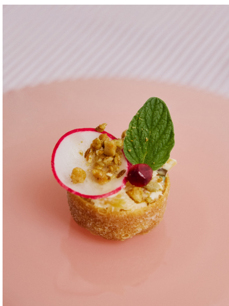
Cup met gele biet tartaar