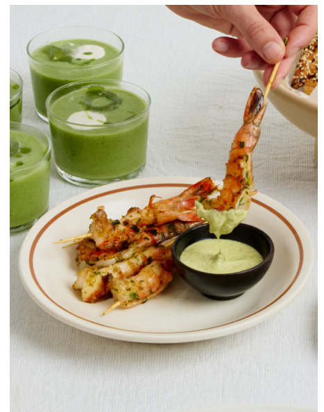
Scampi op een stokje