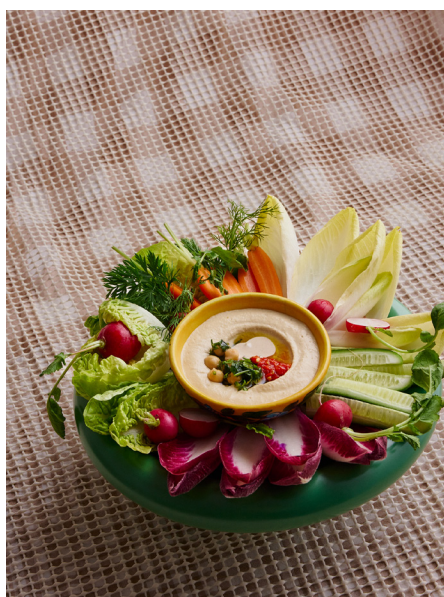
Hummus met dipgroentjes