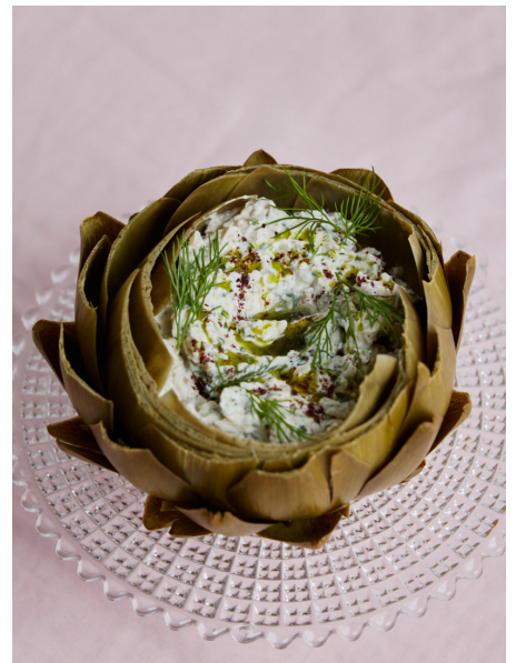
Artisjok met dip